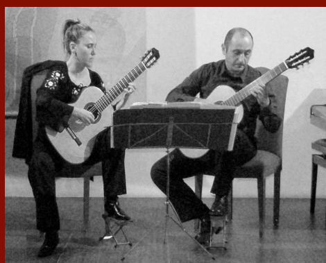
19 OTTOBRE, ore 20.00 DUÒ MASINI - COSTANTINO

AUDITORIUM BIBLIOTECA "P. ALBINO" VIA D'AMATO 86100 CAMPOBASSO