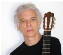
OMAR CYRULNIK ARGENTINA U.N.A. UNIVERSIDAD DE LAS ARTES